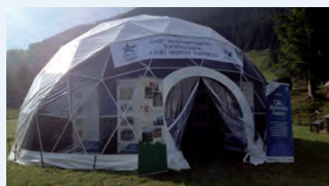
La cupola geodetica utilizzata per le esposizioni itineranti durante le manifestazioni per i 150 anni del CAI